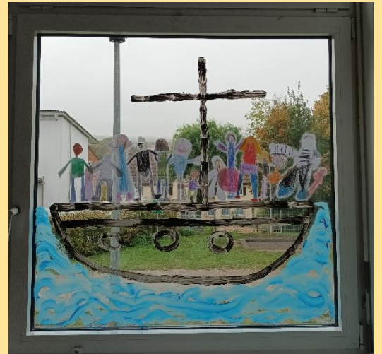
Klasse 1b auf großer Fahrt - Reliunterricht