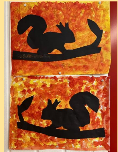
Klasse 2b - Kunstunterricht