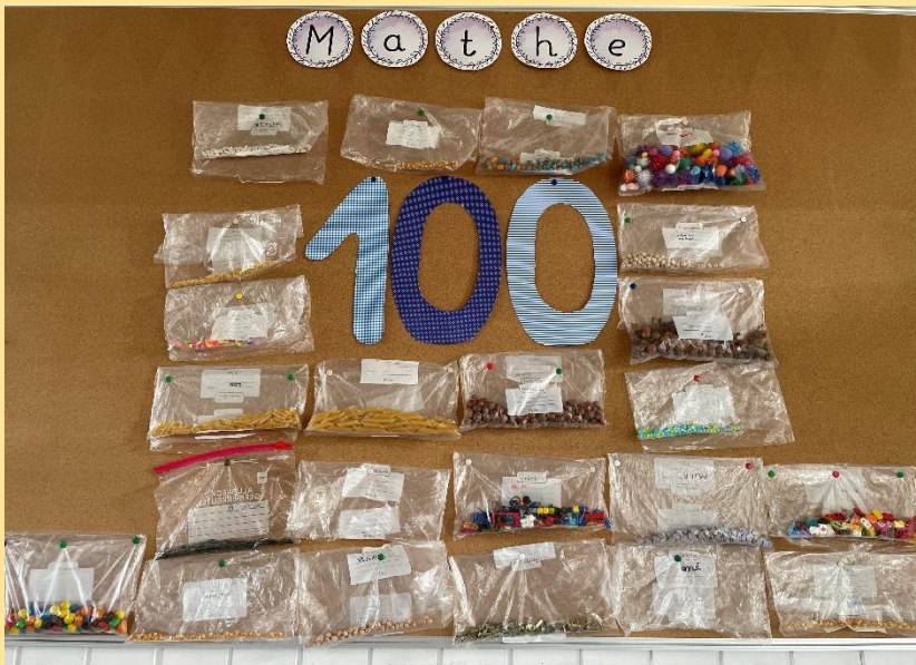
Klasse 2a - Matheunterricht