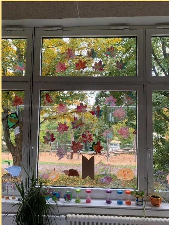
Klasse 1a - Kunstunterricht